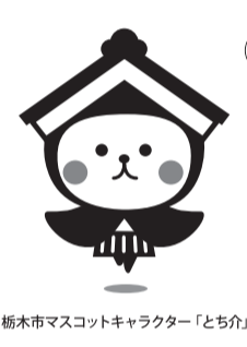
栃木市マスコットキャラクター「とち介」