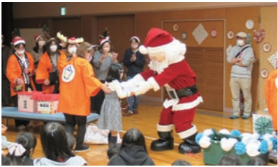
▲サンタクロースのプレゼント抽選会

4mのメガツリー！西方子ども会育成会クリスマス会 12月10日、関東ホーチキにしかた体育館（西方総合文化体育館）を会場に、『西方子ども会育成会 クリスマス会』が開催されました。じゃんけん列車大会、抽選会、ビンゴ大会と、プレゼント企画が目白押し。会場は、プレゼントを持った子どもたちの笑顔が溢れていました。