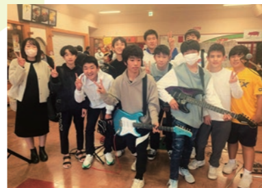
▲バンドマン姿を披露

プラッツおおひら感謝祭に合わせ、交流サロンで『アコースティック・アンサンブル』が開かれました。5グループが出演し、各バンドそれぞれが違った音色を響かせ、生演奏を身近で楽しめる良い機会となりました。出演者の中には、大平南中学校の生徒の姿もありました。同校の元PTA会長をはじめとした地域の大人にギターを習い、その大人の方々とバンドを組んでの出演です。当日は先生や友人が応援に駆け付け、普段とは違った一面を披露していました。