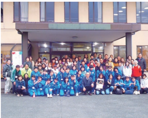
▲講師ボランティアの皆さん

12月16日、藤岡公民館および藤岡文化会館において、藤岡子どもネットワーク主催の『こどもたいけんフェスタ in ふじおか』が開催されました。バルーンアートや射的など15種類もの体験コーナーが設けられ、会場は多くの子どもたちで賑わいました。今回のイベントでは藤岡中学校の生徒もボランティアとして参加しネイルアート等を手伝った他、生徒自らが講師となりクリスマスツリーの飾り作りを教えました。