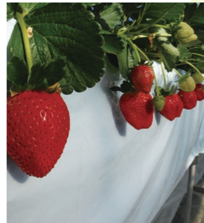
▲おいしそうなイチゴがたくさん

いわふねフルーツパーク（岩舟町下津原）では、12月15日から『イチゴ狩り』が開園し、完熟したイチゴを30分間お腹いっぱい楽しむことができます（要予約）。品種はとちあいか、ロイヤルクイーン、とちおとめ、スカイベリーがあり、それぞれ実施時期や料金などが異なります。直売店で朝摘みのイチゴの販売もしています。お問合せは、観光農園いわふね 55008まで