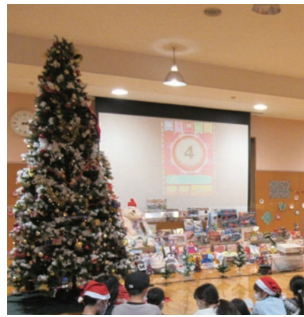
▲4mのメガツリーと山盛りのプレゼント

4mのメガツリー！西方子ども会育成会クリスマス会 12月10日、関東ホーチキにしかた体育館（西方総合文化体育館）を会場に、『西方子ども会育成会 クリスマス会』が開催されました。じゃんけん列車大会、抽選会、ビンゴ大会と、プレゼント企画が目白押し。会場は、プレゼントを持った子どもたちの笑顔が溢れていました。