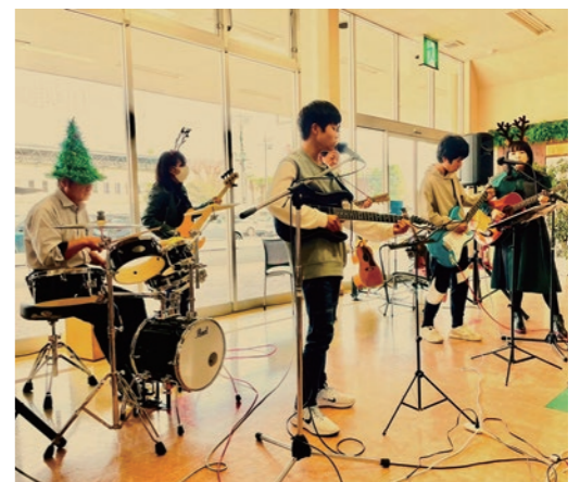
▲心に響く生バンド演奏♪