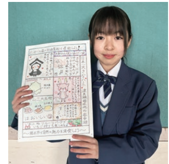
▲クラスの投票で決定した最優秀作品 中学校のHPでもご紹介しています