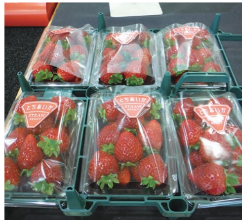
▲直売所で販売されているイチゴ

いわふねフルーツパーク（岩舟町下津原）では、12月15日から『イチゴ狩り』が開園し、完熟したイチゴを30分間お腹いっぱい楽しむことができます（要予約）。品種はとちあいか、ロイヤルクイーン、とちおとめ、スカイベリーがあり、それぞれ実施時期や料金などが異なります。直売店で朝摘みのイチゴの販売もしています。お問合せは、観光農園いわふね 55008まで