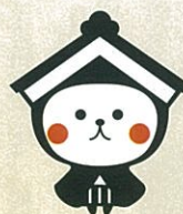
栃木市マスコットキャラクターとち介