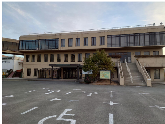
藤岡公民館 (1973年度築)

総合支所の複合化事業については【裏面】「藤岡総合支所の複合化について」をご覧ください。