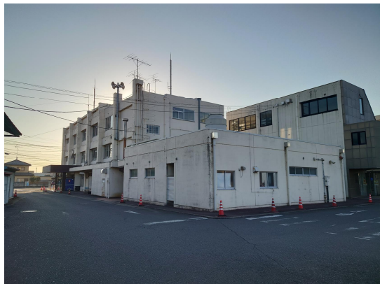
藤岡総合支所 (1960年度築)