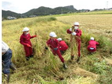
〔たくさんとれるかな〕

5年生は毎年、総合的な学習の時間での稲の栽培について、学区の農家の方々にお世話になっています。5月には「田植え」、9月には「稲刈り」を体験させていただいています。また田植えの際に苗を分けていただき、学校でも稲を栽培しました。児童は、毎日稲を観察し、成長を見守り、秋には、実った稲穂を刈り取りました。