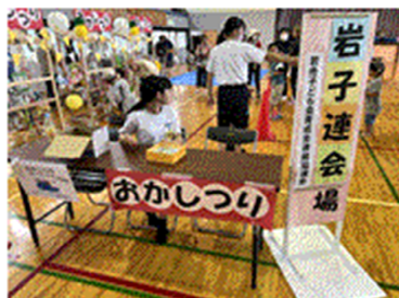
〔各コーナーを担当〕

7月に岩舟公民館において「こどもフェスティバル」が開催されました。マリオネットの人形劇やミュージック・ケア、消防団体験、縁日コーナー、びしょぬれタイム、各種ワークショップ体験など盛りだくさんの内容で、子どもたちは、夏のひと時を楽しんでいました。生徒たちは運営スタッフとして参加し、積極的にボランティア活動をしていました。