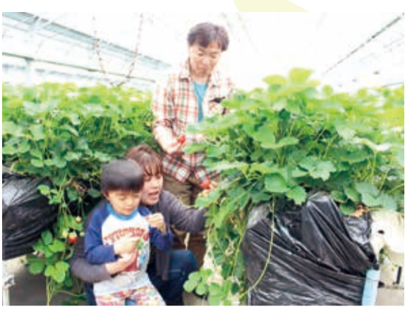
▲ 家族みんなで大きないちごを味わいました

5月3日から5日にかけて、道の駅にしかたをメイン会場に「西方いちご祭り」が開催されました。祭り期間中は各種模擬店が出店し多くの人で賑わいました。また、いちご生産者の協力により毎年恒例となった「いちご狩り」も行われ、参加者たちは真っ赤ないちごを口いっぱい頬張っていました。