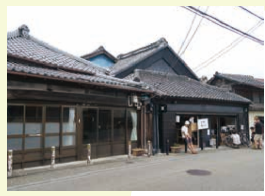
▲ 古き良き街並みを残す嘉右衛門町

歴史的な街並みを残す嘉右衛門町の伝統的建造物群保存地区において、5月28日、29日の2日間、「クラモノ。008」が開催されました。個性的でおしゃれな雑貨やこだわりのフードなど数多くの店舗が立ち並び、ライブ演奏も行われました。天候にも恵まれ、たくさんの人でにぎわい活気のある2日間となりました。