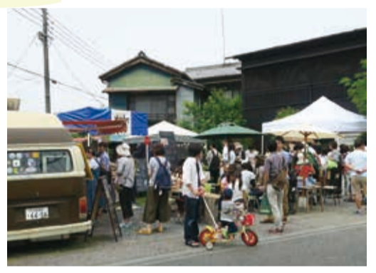
▲ 個性派雑貨やおいしいフードの販売も