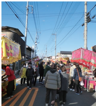
▲賑わう藤岡中央通りの様子