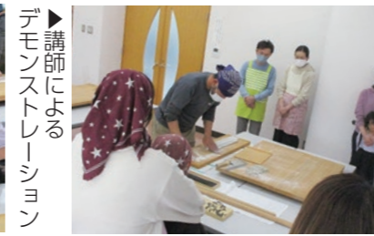
▶講師によるデモンストレーション