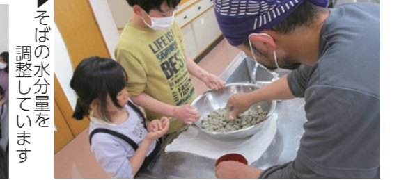
▶そばの水分量を調整しています