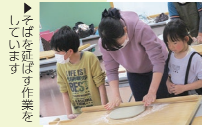
▶そばを延ばす作業をしています

今回で2回目の開催となり、親子連れを中心に多くの皆さんが参加しました。参加者の皆さんはそば打ちに汗を流し、充実の一日となりました。