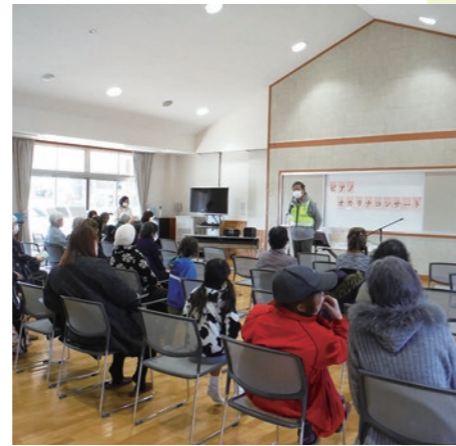
▲地域の皆さんでにぎわっていました

2月11日、まちづくり実働組織「静和まちづくり協議会」が、静和地区公民館で「第4回イイまち静和フェスティバル」を開催しました。