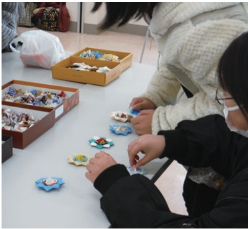
▲きれいなカラフルこまを作りました

2月11日、まちづくり実働組織「静和まちづくり協議会」が、静和地区公民館で「第4回イイまち静和フェスティバル」を開催しました。 カラフルこま等の工作や、子どもの映画会、ピアノ&オカリナコンサートが行われ、大人も子どもも楽しく交流をしていました。