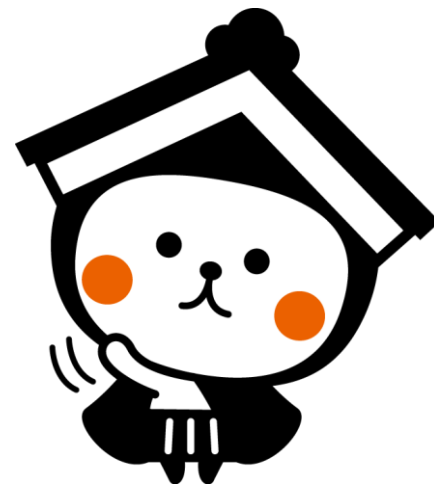
栃木市マスコットキャラクター とち介

ただし居住要件がありますので、詳しくは、選挙管理委員会までお問い合わせください。