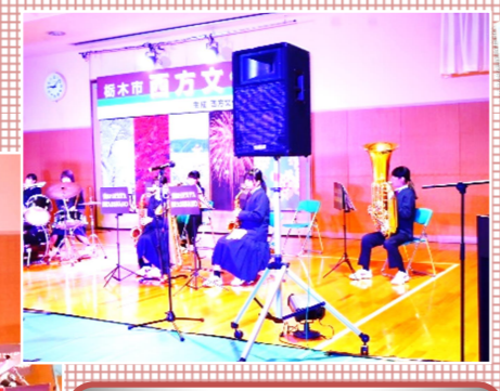
西方中学校 ブラスバンド部