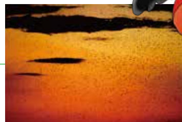
夕暮れ時ねぐら入りするツバメ