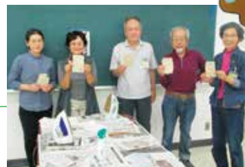
ヨシ紙ハガキづくり