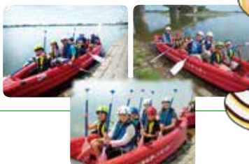
Eボートで自然観察へ!