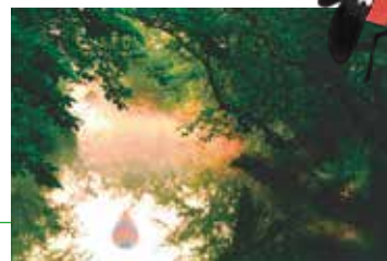
最優秀賞「川霧に浮く」