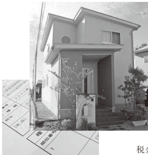
不動産(家屋・土地)の差押