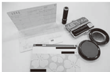
預貯金・給与・年金の差押