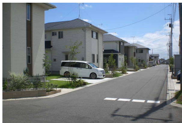
『箱森西部地区(区画道路)』