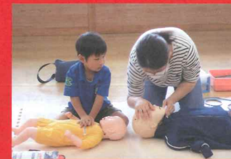
赤十字幼児安全法講習(さくら市)