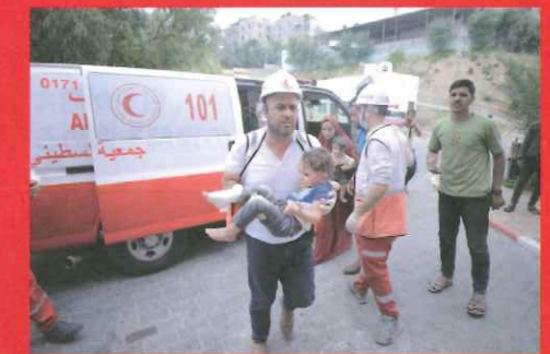
ガゼ 負傷者の搬送