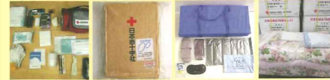
緊急セット 毛布 安眠セット 布団セット

救護員やボランティアに対する研修と訓練、救護活動用の資材や救援物資を整備しています。