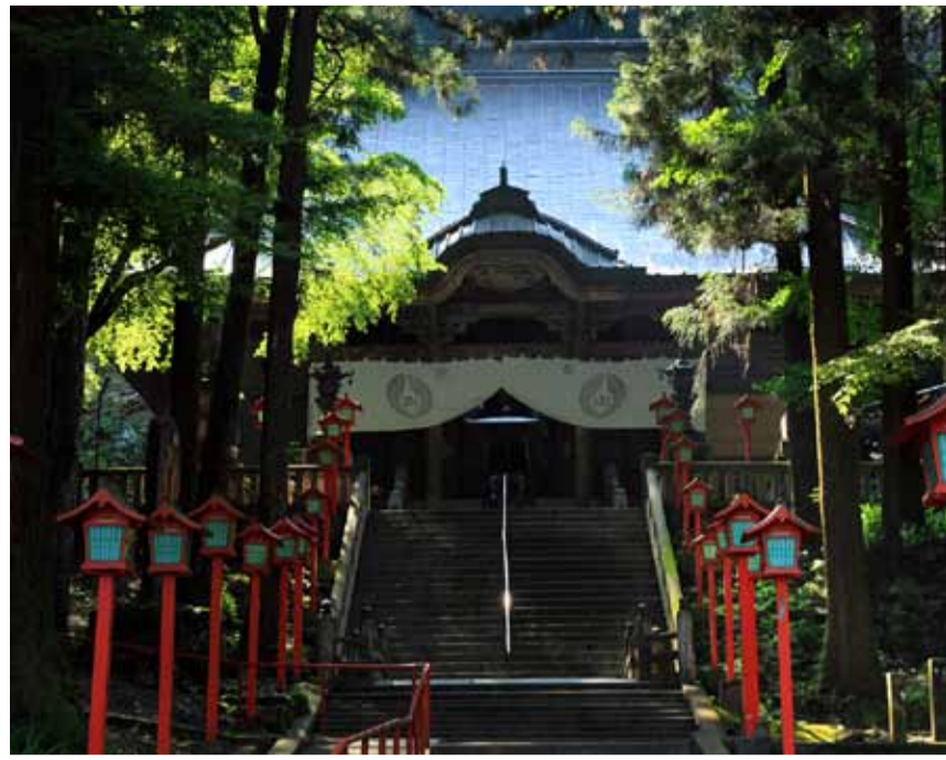
千手観音菩薩を祭る本堂(写真㉔)と奥の院(写真㉕)