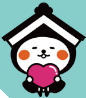
栃木市 マスコットキャラクター とち介