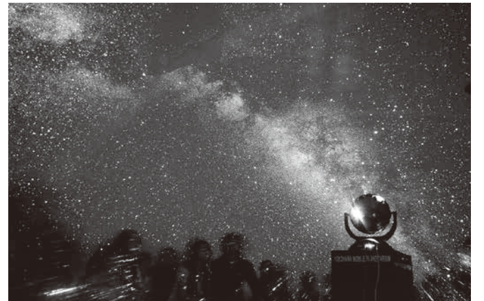
▲横浜モバイルプラネタリウムメカスターゼロの実際の投影の様子