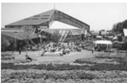
とちぎ花センター