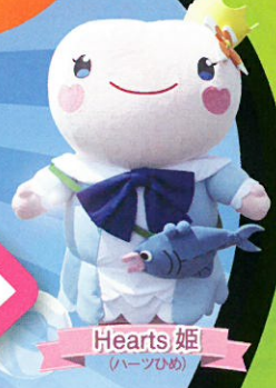
Hearts 姫 (ハーツひめ)