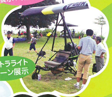
ウルトラライト プレーン展示