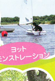
ヨット デモンストレーション