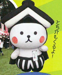
渡良瀬遊水地 栃木市 PR ブース