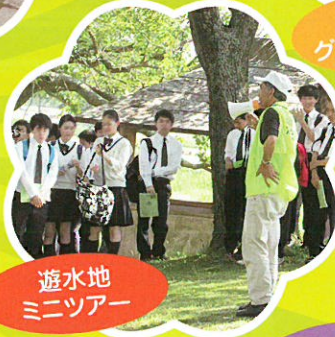
遊水地 ミニツアー

主催 / 渡良瀬遊水地フェスティバル実行委員会 共催 / 栃木市 後援 / 国土交通省関東地方整備局利根川上流河川事務所・(一財)渡良瀬遊水地アクリメーション振興財団 藤岡町商工会・藤岡町観光協会・埼玉県加須市・群馬県板倉町・東武鉄道(株)・(株)下野新聞社 お問合せ / 渡良瀬遊水地フェスティバル実行委員会(栃木市役所 遊水地課) TEL: 0282-62-0919 mail: wise-use@city.tochigi.lg.jp