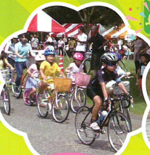
キッズパレード 体験