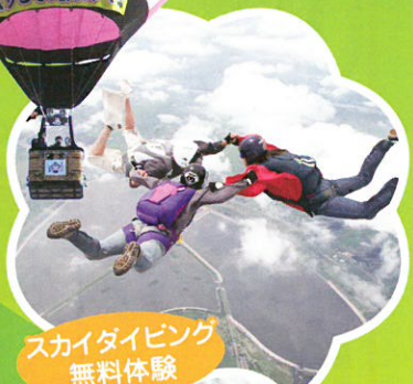
スカイダイビング 無料体験