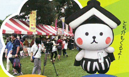
ご当地 グルメブース