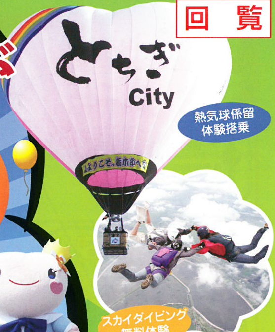
熱気球係留 体験搭乗