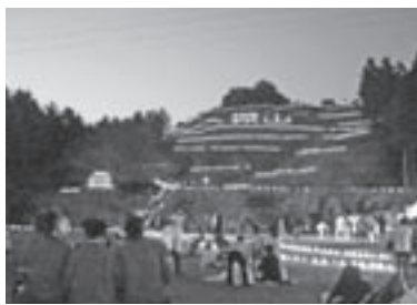
▲皆川城址(あんどん)まつりの様子

皆川地区街づくり協議会では、第6回『皆川城址まつり』を開催します。近所お誘いあわせのうえお越しください。 ◇日時 9月25日(土) 午前11時～午後8時 ※雨天時 翌26日(日) ◇場所 皆川公民館および城址公園(皆川城内町) ◇内容 ○昼間：ステージを中心によさこい踊り・演芸等の発表 ○暗くなるころ：ペットボトルにローソクを灯した「あんどん」を城山の麓から中腹まで並べ、まつりのクライマックス ○模擬店も多く出店 ◇問合先 皆川地区街づくり協議会(皆川公民館内/☎(22)1812)