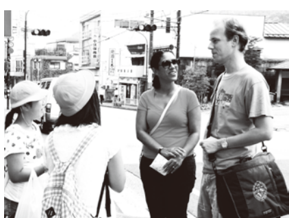
英語をつかってコミュニケーション

小規模特認校・大宮南小学校の説明会を行います！ 期日：9 月 15 日（土） 時間：13:30～ 場所：市役所別館第 2 会議室 対象：小規模特認校に入学・転入学を希望する保護者