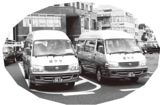
本 交通防犯課 ☎ 21 - 2170

は、平成 25 年度末までの試行運行中です。この期間中に利用状況や市民の皆さんのご意見・ご要望を踏まえて運行内容の見直し・改善を行います。それでも利用状況に改善が見られない場合は、廃止についても検討することになります。日常生活や市内散策の足として、どうぞ歳タクとふれあいバスをご利用ください。