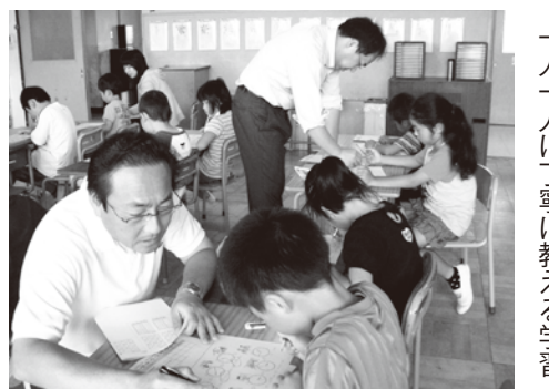
一人一人丁寧に教える学習

本市では、平成 25 年度から小規模特認校制度がスタートします。これは、小規模校の良さを生かした教育を希望する子どもたちが通常の通学区域にかかわらず、市内どこからでも通うことができる制度です。