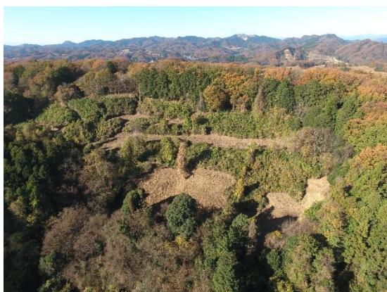
西方城跡 山頂部

宇都宮氏の一族である西方氏が築いた中世後半から近世初頭の山城です。山頂部と山麓部にそれぞれ城館が築かれたことがわかっており、2つの城館をまとめて「西方城跡」と呼んでいます。平成30年から始まった調査の結果、時代とともに西方氏、結城氏、藤田氏と城主が交代し、北関東の政治的背景と連動して、山城の規模や構造が大きく変化していることがわかりました。当時の城館の在り方と、それが歴史と共にどのように変化していったのかをうかがい知ることができる、重要な山城です。