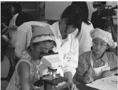
高校生と一緒にパン作り

日時 9月28日(土) 9時~12時 場所 栃木農業高等学校(平井町) 対象 市内小学4~6年生20人(定員を超えた場合は抽選) 内容 栃木農業高等学校の先生と高校生の支援を受けて、おいしいロールパンを作ります。また、目に見えない小さな生き物についての実験、観察を行います。 参加費 800円程度 申込・問合先 9月6日(金)~18日(水) 本 生涯学習課 ☎ 21-2731