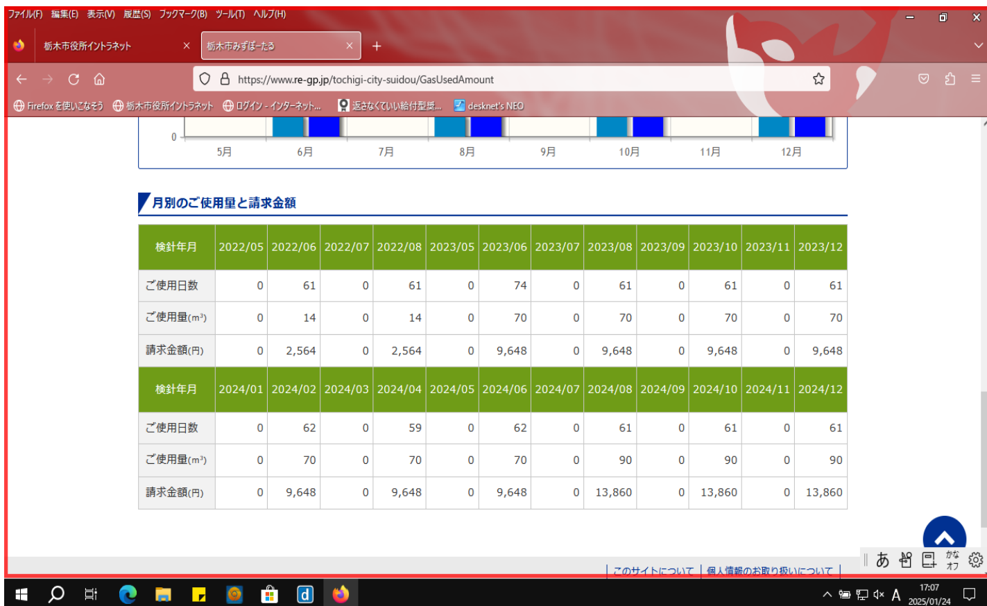
《月別のご使用量と請求金額》