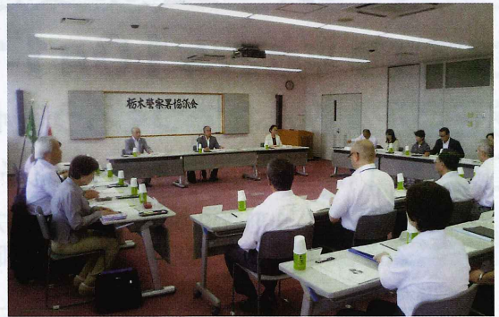
■平成27年度の委員をご紹介します。