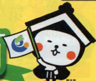
栃木市 マスコットキャラクター 「とちぎ」