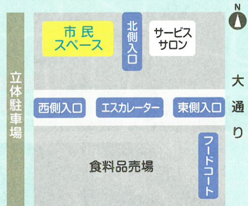
東武百貨店栃木市役所店1階