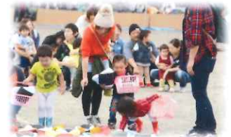
「今日のお弁当なあに」