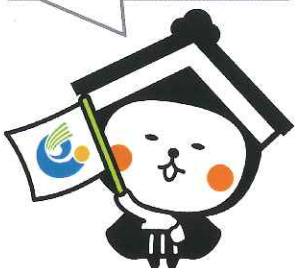
栃木市マスコットキャラクター とち介

緑が芽生える声ことりのさえずり聞こえる この地に生まれてきて私は今ここに 湧き出る尽きせぬ水は誇らしく輝き きよらかな心守り明日への希望をうたう 変わらぬ思い寄せる神々宿る太平山 この地に育てられて私は今ここに 恵みの雨空仰ぎあじさいがはなやく やさしい心守り未来の光をつくる 穏やかながれゆく歴史を運ぶ巴波川 この地と共に歩み私は今ここに 渡良瀬の遊水地は四方に命満ちて ゆたかな心守り未来をきづく栃木市 未来をきづく栃木市