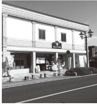
FMくらら857コエドスタジオは、倭町のコエド市場内にあります

答 藤岡地域と岩舟地域の国道50号南側の一部地域、真名子、出流、皆川などの市北西部の山間地域を想定している。