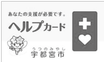
宇都宮市のヘルプカード 中を開くと「手助けしてほしいこと」などが記されています

なお、導入に当たっては、障がい者の方が、市外に行っても、その効果が十分発揮されるよう、既に導入している宇都宮市や今後導入を検討している他市町とも、連携を図っていききたいと考えている。