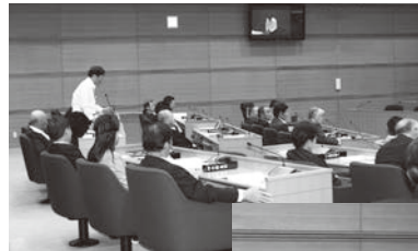
所信表明の内容に対 して他の議員から質 問があり、それぞれ の考えを述べました