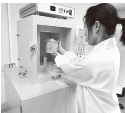
モニタリング検査の様子

さらに山菜類については、出荷用チェック票を配布し、どこで収穫や採取をしたかについて、販売する農産物直売所へ提出するよう指導していききたい。