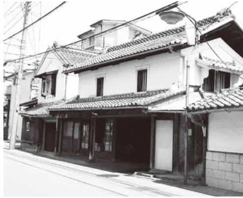
ヤマサみそ製造工場跡地