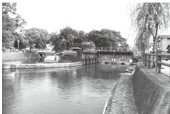
巴波川の瀬戸河原堰 (瀬戸河原公園周辺)

今後においては、施設管理者を明確にし、緊急時の対応が迅速に取れるよう、緊急連絡網の整備を行っていく。また、今回のような大規模災害を想定した、施設の管理運転方法のマニュアル化や、関係する土地改良区等との連携を一層緊密にし、同じような被害が生じないよう取り組み、水門等の操作による内水氾濫などの被害を未然に防いでいきたい。