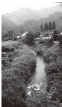
地定のダム摩南摩南

また、本市の一部地域では、地下水を表流水と同様に浄水処理した水道水を供給しているが、必ずしも味が落ちるとは言えない。安心で安全な水道水を、安定的に供給していくことが重要と考えている。