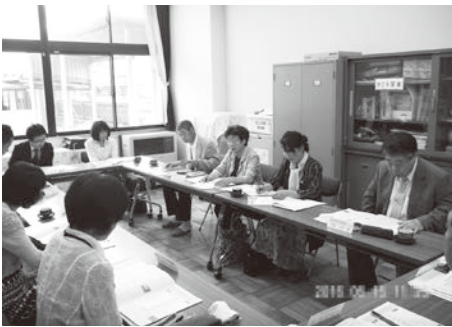
学校運営協議会制度は「地域とともにある学校づくり」を進める仕組みです（国府北小の学校運営協議会の様子）

また、全国学力・学習状況調査では、同じ市町村内のコミュニティ・スクールである小学校とそうでない小学校とでは、学力の改善状況に差が見られ、児童の学習意欲が高まったなど、様々なメリットが確認されている。