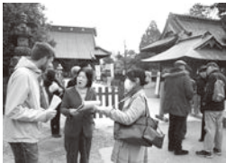
英語ボランティアによるALTの協力による観光ボランティア養成講座現場研修

本市の観光振興は、いかに地域の皆様一人一人が、地域を愛し、観光客に対するおもてなしの向上を図っていくかが最も重要である。今後は、市民の皆様とともに、本市の豊かな観光資源の認識を深め、おもてなしの向上や機運の醸成を図れるような仕組み作りを検討していきたい。