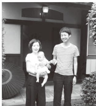
ですが、素敵がみ町堀のお蔵が、栃木市が温かくて、人もなりました。

答 希望された期間に先約が入っており重複してしまったため、2 名の方にお断りをさせていただいたケースがある。現在、市内に 1 棟しかないため、今年度中に空き家等を活用した同様の「移住おためしの家」をさらに 1 棟増やす計画をしている。