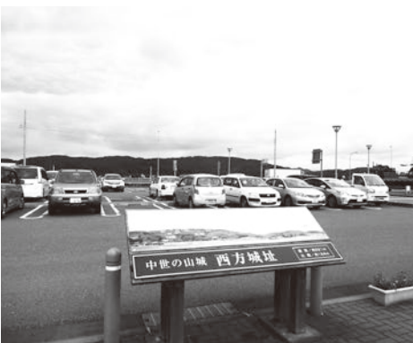
道の駅にしかたから眺める西方城址と案内板

今後は、市指定史跡としての文化財指定を視野に入れ、地域の方々と協議を進めるとともに、西方城址の詳細な全体像を明らかにするため、専門家による城址の調査の時期について検討していく。