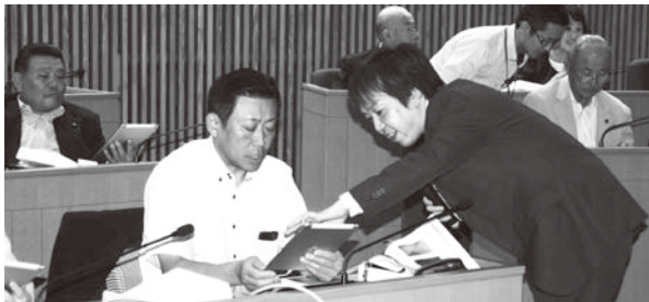
タブレット研修会の様子

これにより、素早く連絡を取り合ったり、スケジュールを共有したり、大量の資料を出先でも見られたり、会議等で使う紙の量を減らしたりと、さまざまなメリットが期待されます。