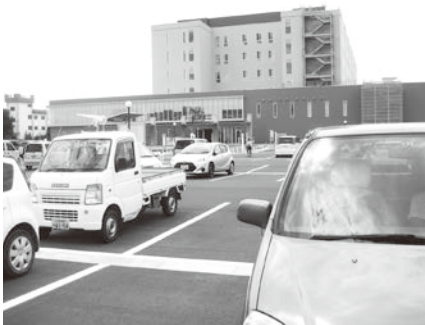
とちぎメディカルセンターしもつが駐車場

また、新病院「しもつが」の駐車料金について、見舞いや面会等一般の方の駐車場料金が少し高いとの苦情もお聞きしている。今後、とちぎメディカルセンターには、料金の設定について、検討していただくよう要望していきたい。