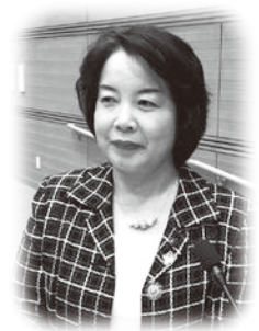
古沢ちい子 議員 公明党議員会