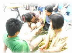
エピソードレーナー

緊急対応が必要とされる場面に、いつ誰が立ち会うことになるか分からない為、教職員全員が対応方法を理解していることが大切という考えのもと、参加した教職員は全員が大変熱心に受講しました。