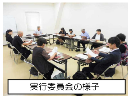
実行委員会の様子