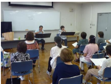
オカリナ演奏と合唱講座