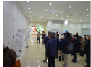
東洋水産工場見学