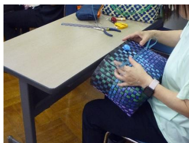
やさしい手芸講座