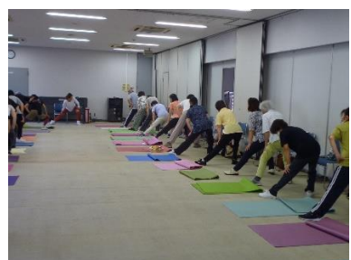
はつらつ体操講座