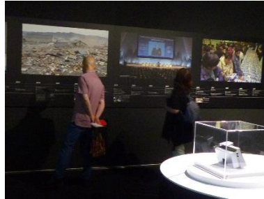
日立オリジンパーク見学