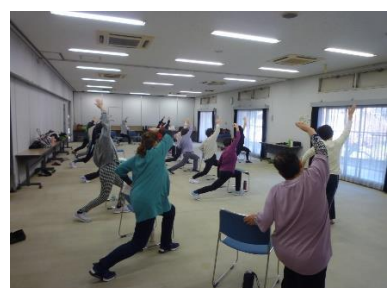
スローエアロビ教室