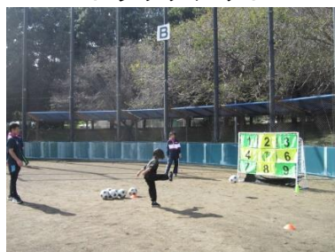
キックターゲット