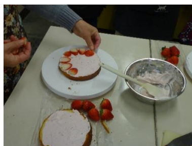
手作りケーキ教室