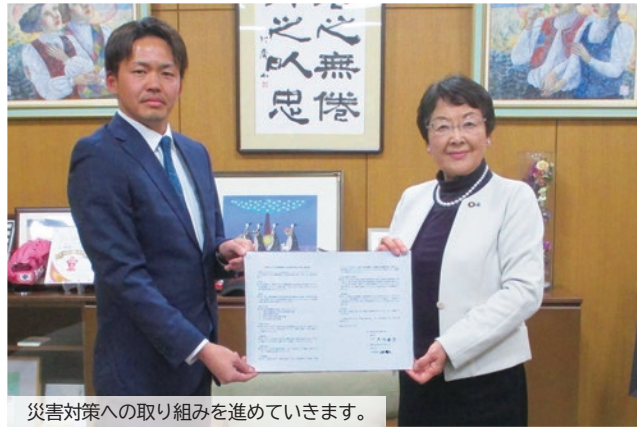
災害対策への取り組みを進めています。