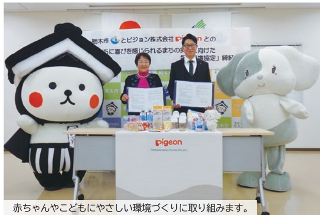
赤ちゃんや子どもにやさしい環境づくりに取り組みます。

12月17日、スポットクーラーや発電機、蓄電池等を常時保有し、災害時に迅速な対応が可能である株式会社シェノンテックと「災害時における空調設備等の応急対策の協力に関する協定」を締結しました。本協定は、災害時において避難者の生活環境の向上を図ることを目的として、可搬式空調機器および固定式空調設備の設置、可搬式発電機の設置、仮設の水道および電気設備の設置等を行うものです。