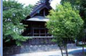
고렌구라(참고 다섯 곳)