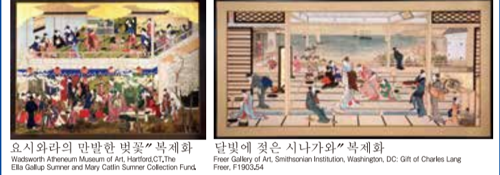
요시와라의 만발한 벚꽃" 복제화 Wadsworth Atheneum Museum of Art, Hartford, CT, The Ella Gallup Sumner and Mary Catlin Sumner Collection Fund. 달빛에 젖은 시나가와" 복제화 Freer Gallery of Art, Smithsonian Institution, Washington, DC: Gift of Charles Lang Freer, F1903.54

기타가와 우타마로(喜多川歌麿)는 에도시대 중기의 우키요에(浮世繪) 화가였는데, 최근에 우타마로가 직접 그린 세 절의 그림이 도치기에서 오랜 세월 뿌리내리고 살아온 한 가문에서 발견되었습니다. 각 작품의 명칭은 "다르마의 여인", "종규(鍾植)", "행운을 주는 세 스모신"입니다. 에도시대에 도치기는 번영을 구가하던 상업도시였습니다. 사람들은 도시 중앙을 관통해 흐르는 우즈마 운하를 따라 에도(도쿄의 옛 이름)로 갔습니다. 에도와 밀접한 관계가 있던 도치기는 자연스럽게 문명화되어 도시 전체가 요카(狂歌) 또는 단카(短歌) 예술이 성행했습니다. 요카는 각각 5, 7, 5, 7, 7음절의 5행으로 구성되는 억살스럽고 풍자적인 일본 시입니다. 시문학계에서는 후대도 아마마루라고도 알려진 우타마로는 도치기에서 광범위한 상거래 활동을 벌이던 상인들에게 친숙한 이름이었습니다. "눈에 덮인 후카가와", "달빛에 젖은 시나가와" 및 "요시와라의 만발한 벚꽃"과 같은 우타마로의 대작들은 도치기의 부유한 상인 가문인 젠노가의 요청으로 그려진 작품이라고 합니다