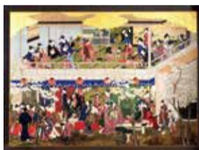
吉原之花图(复制品) Wadsworth Atheneum Museum of Art, Hartford, CT. The Ella Gallup Sumner and Mary Catlin Sumner Collection Fund.

喜多川歌麿是活跃于江户时代中期的浮世绘画家。他的三幅作品—女达磨图、钟馗图及三福神相扑图—最近于栃木市一旧民居被发现。栃木在江户时代是个繁荣的商业城市，居民都利用穿流市中心的巴波河来往江户(当时的东京)。由于与江户交流紧密，栃木亦变得有文化气息，狂歌及短歌文化随之在市内盛行。狂歌是带有讽刺时弊及诙谐味道，每句由5、7、5、7、7个音节共5句所构成的日式诗词。歌麿在诗词界亦名为“笔之绫丸”，与在栃木作大手投资的商人关系甚好。歌麿的大型作品—深川之雪图、品川之月图及吉原之花图—据说是应栃木富商善野家的要求而画的。