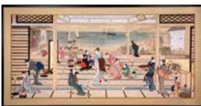
品川之月图(复制品) Freer Gallery of Art, Smithsonian Institution, Washington, DC. Gift of Charles Lang Freer, F1903.54