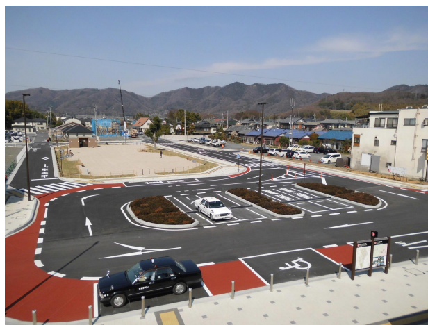
『新大平下駅前第2地区(駅前広場)』