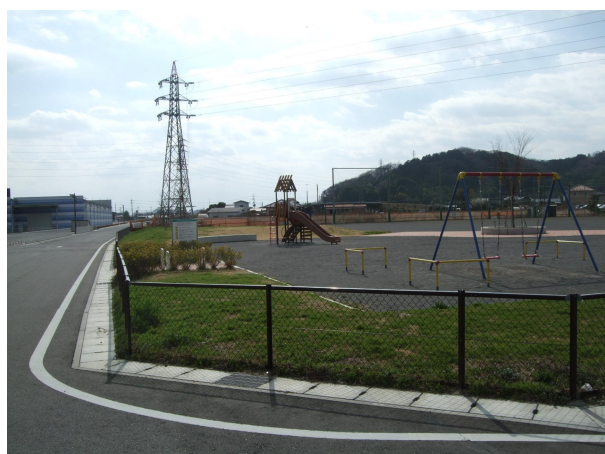
『栃木藤岡バイパス下皆川・富田地区 （街区公園）』