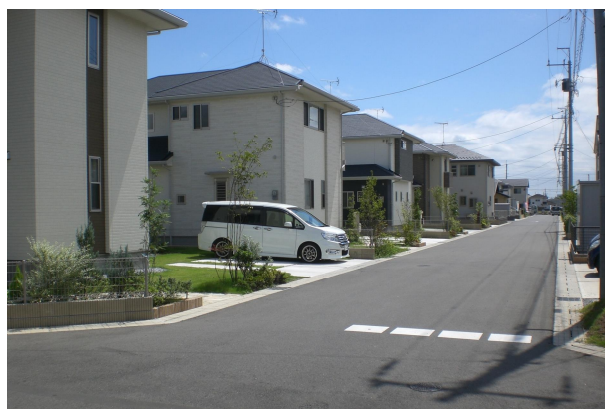
『箱森西部地区（区画道路）』