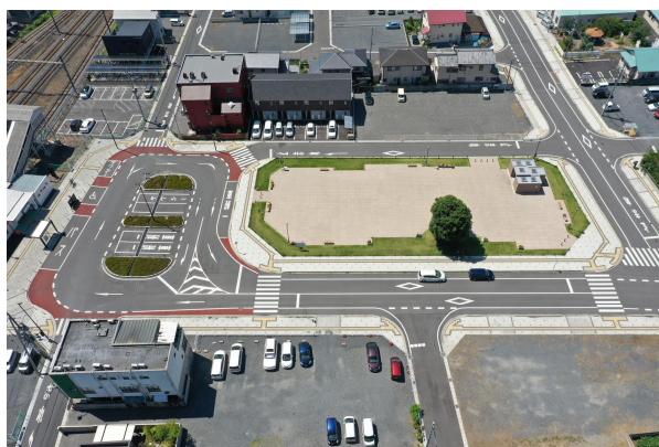
『新大平下駅前第2地区 （駅前広場と街区公園）』