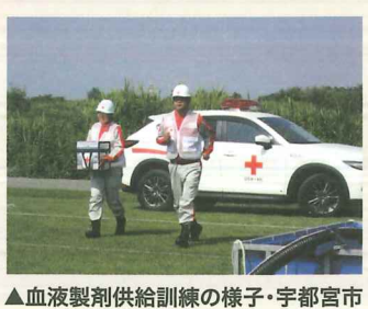
▲血液製剤供給訓練の様子・宇都宮市