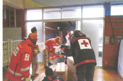
▲救援物資搬送を行う日赤スタッフ 岩手県大船渡市