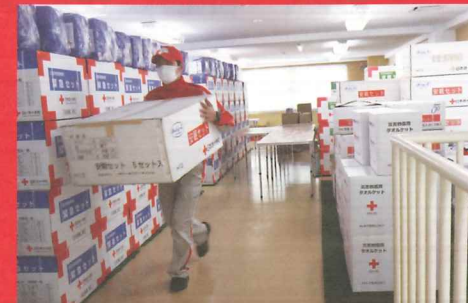
今治市林野火災 支部倉庫から救援物資を出している様子