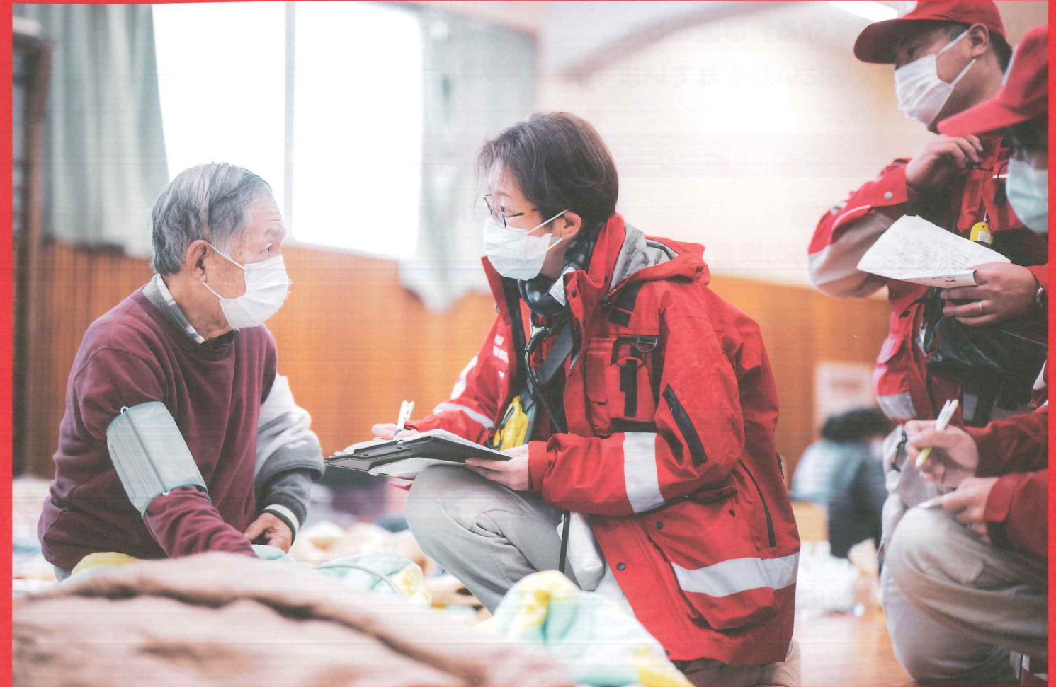
令和6年能登半島地震 石川県輪島市の避難所の巡回診療

地震や頻発する大雨災害、日常に潜む病気や怪我、世界各地の人道危機。助けあうことで救える人々があります。「救う」活動を続けるため、どうか、赤十字活動資金への温かいご協力をお願いいたします。