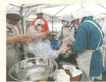
▲非常食炊き出し研修の様子・宇都宮市

被災地で迅速な医療救護活動を展開するため、様々な想定をし、関係機関と連携しながら訓練を実施しています。