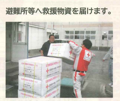
▲令和元年東日本台風・小山市