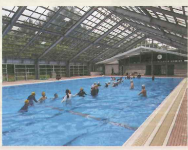
▲水上安全法講習・那須町

救命手当や応急手当を学ぶ「救急法」「幼児安全法」「水上安全法」、健康や介護を学ぶ「健康生活支援講習」を実施しています。