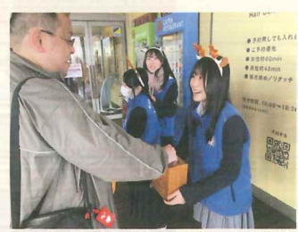
▲街頭募金を行う青少年赤十字メンバー 宇都宮市

災害時、全国的な血液製剤の需給調整機能を活用して、被災地において必要な血液製剤の確保に努めます。