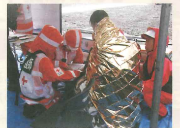
▲出水期に向けた訓練の様子・宇都宮市