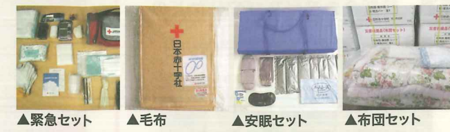
▲緊急セット ▲毛布 ▲安眠セット ▲布団セット

救護員やボランティアに対する研修と訓練、救護活動用資材や救援物資を整備しています。