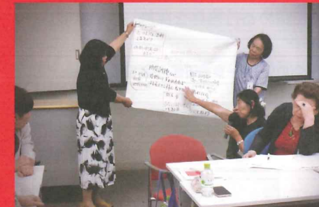
奉仕団会議 自団の活動状況を報告する奉仕団員