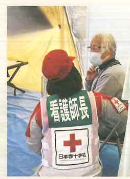
▲救護所内での診療の様子 石川県珠洲市