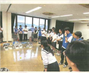
▲国際人道法を学ぶ青少年赤十字メンバー・宇都宮市