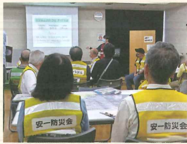
▲自治会員対象に実施した防災セミナーの様子・壬生町

地域の自助や共助の力を高め、災害から住民を守る知識を伝える「防災セミナー」を実施しています。