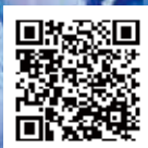
とちぎあじさいまつり ホームページ