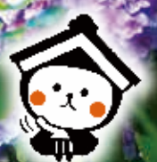
栃木市マスコットキャラクター とち介

6月27日(土) 11時から11時30分 場所:あじさい坂ふもと (雨天時は中止となります)