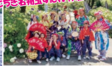
南京玉すだれ 楽しい会