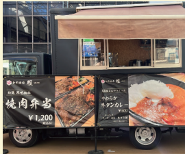
和牛焼肉 雅 〈お弁当〉