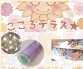
こころテラス☆ 〈グッズ販売・ワークショップ〉