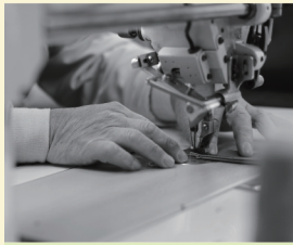
いちひこ帆布 〈バッグ・小物〉