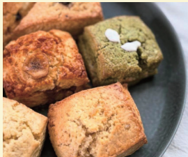
spica cafe+bake 〈焼菓子・ドリンク〉