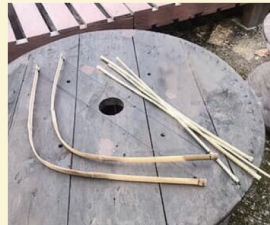
チーム星のプロジェクト 〈竹弓づくりワークショップ〉