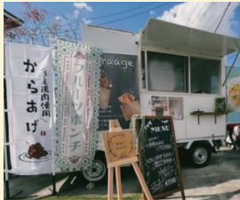
給食キッチンカーkotori 〈唐揚げ・揚げパンなど〉