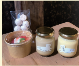
山々と星々 〈プリン・菓子・ドリンク・生活道具〉