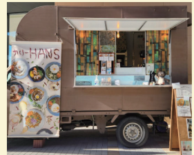
カレーHANS 〈カレー・ドリンク〉