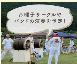
ミュージックエリア