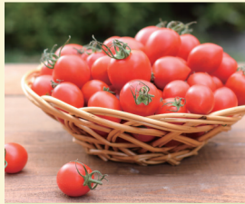
パナプラス 〈ミニトマト〉