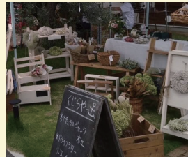
くじらや 〈花・ナチュラルジャンク木工〉