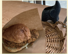
福ぞう商店 〈お惣菜〉