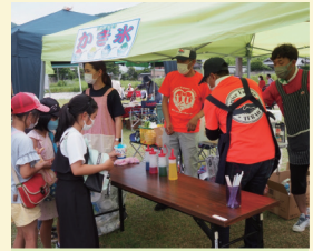
active future 寺尾 〈フランクフルト・かき氷など〉