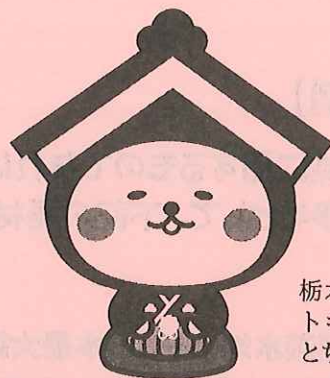
栃木市マスコットキャラクター とち介

藤岡地域かるたの読み札を募集します。 藤岡の好きなところ、知っていること、楽しい思い出を「読み札」にしてみましょう。