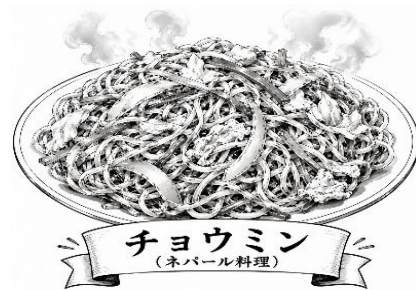
チョウミン (ネパール料理)