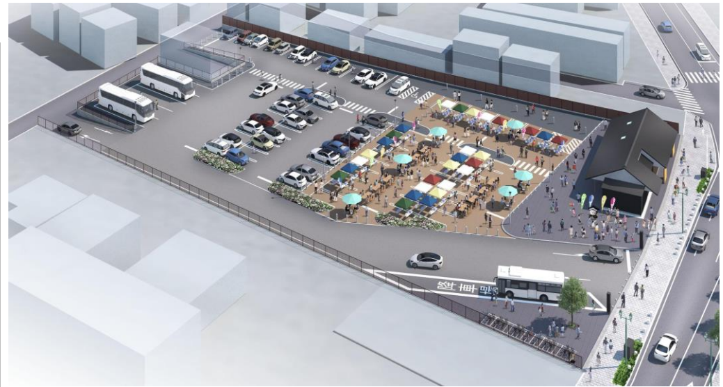
イメージ図（大通り北側から）