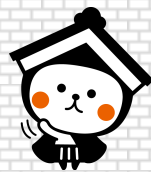
栃木市マスコットキャラクター とち介

※会議は傍聴できますので、ご希望の方は開始時刻までに会場へお越しください。但し、内容によっては非公開になる場合もありますので、ご承知おきください。