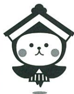
栃木市マスコットキャラクターとちや