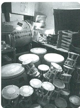
▶保管されている太鼓等