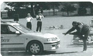
▲交通安全教室の様子