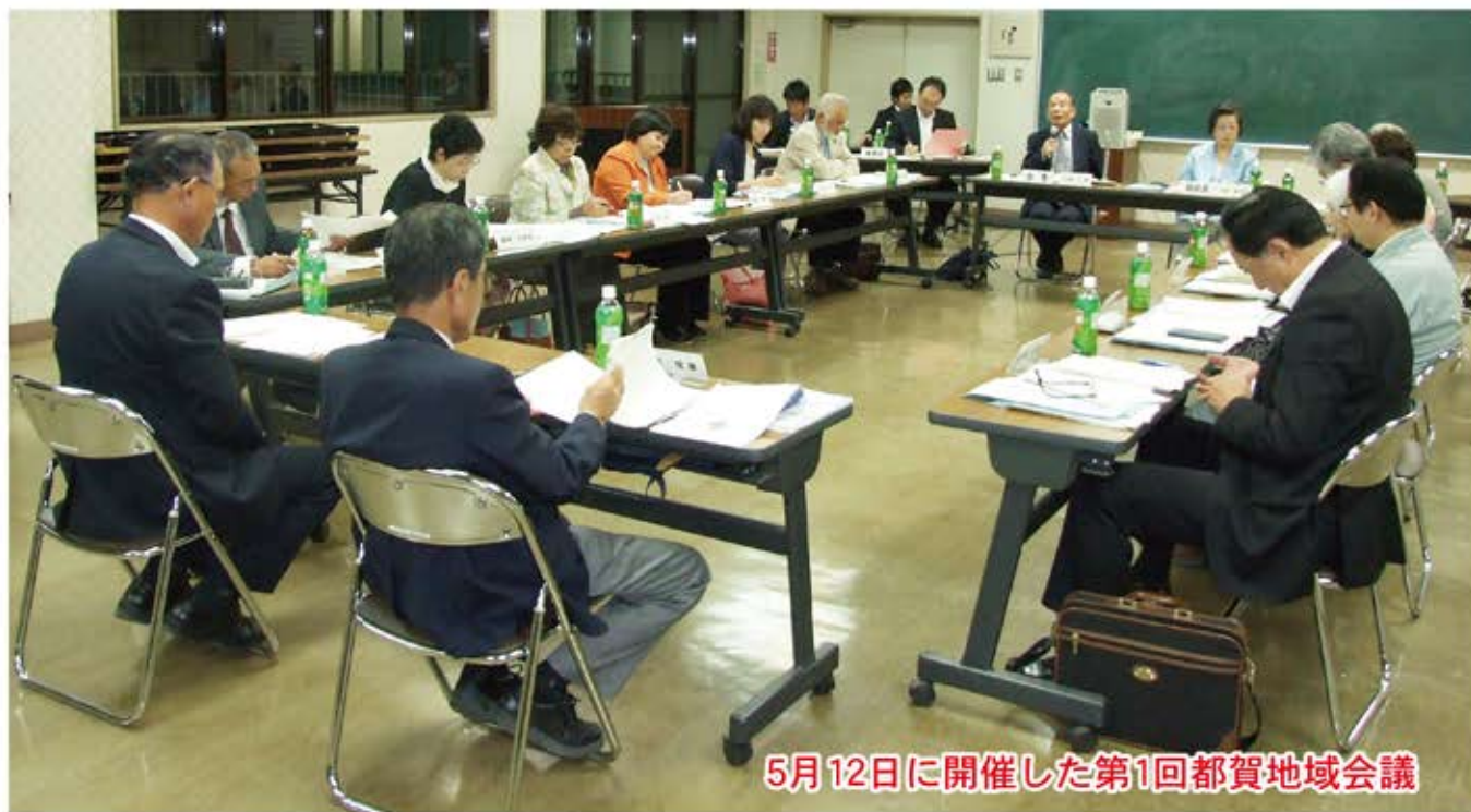
5月12日に開催した第1回都賀地域会議