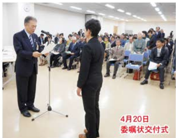
4月20日 委嘱状交付式

地域まちづくりセンター 「地域会議」の事務局を担当するとともに「まちづくり実働組織」の運営支援など、住民主体の地域づくりを支援します。地域会議だよりでは、都賀地域会議の活動の様子や都賀地域のまちづくりに関するお知らせをしていきます。