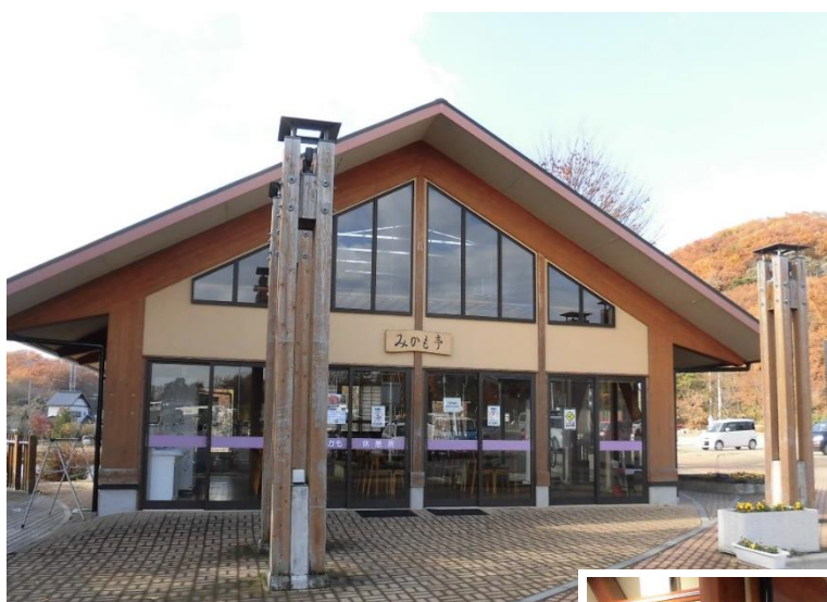
オープン記念写真展(平成30年3月)