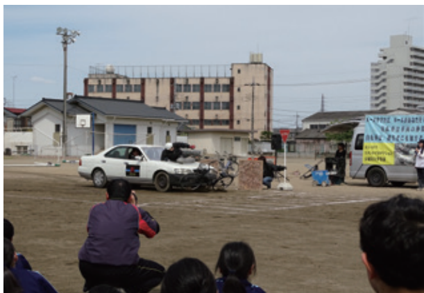
※プロのスタントマンが交通事故の再現をすることにより事故の恐怖や衝撃を実感する方法

昨年の栃木中央地域会議から地域予算提案制度により提案された事業が実施されました。今後も、制度により提案された事業（あいさつリーダー運動等）が随時行われます。