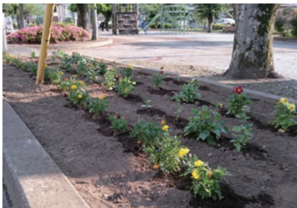
色とりどりの花が植えられ公園も一層華やかになりました

同じく昨年の地域予算提案制度により提案された、花と緑のまちづくり事業が実施されました。栃木中央地域内の公園の美化を図り、地域における世代間交流を促進する場を整備するため、なかよし公園（片柳町4丁目）の花壇の土の入れ替えを行いました。その後、6月4日に周辺住民と栃木西中学校生徒会の皆さんが協力して花を植え、世代間の交流を図ると共に、地域の緑化・美化が進みました。