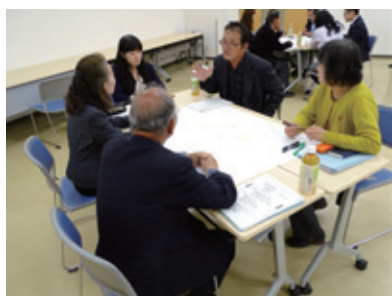
地域課題についての意見交換