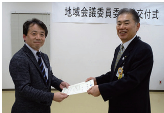
市長より委嘱状を受ける委員

地域会議が始動して平成29年で3年目となり、任期が2年の地域会議委員も改選の年となりました。栃木中央地域では18名の方が委員に選任され、4月10日に委嘱状交付式が開催されました。新体制となった4月より、会議が開催されています。主な内容について下記の通りご紹介します。